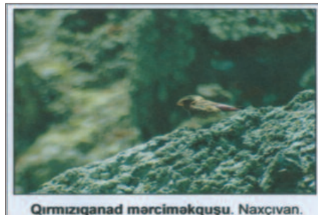
Qırmızıqanad marməkəquşu. Naxçıvan.

Səfər müddətində Naxçıvanda 185 quş növü gördük ki, onlardan da 44-ü mənim üçün yeni quş növləri idi. Mən bu əraziyə yenidən qayıtmaq niyyətindəyəm.