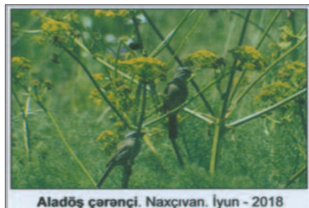
Aladöş çərənçi. Naxçıvan. İyun - 2018