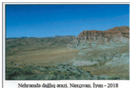
Nəhrəndə dağlıq ərazi. Naxçıvan. İyun - 2018