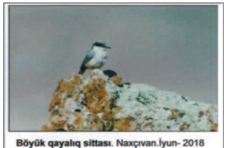
Böyük qayalıq sittası. Naxçıvan. İyun - 2018