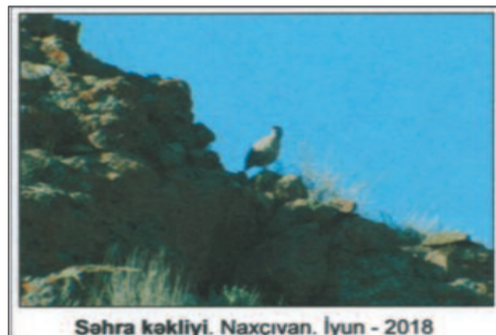
Səhra kəkliyi. Naxçıvan. İyun - 2018