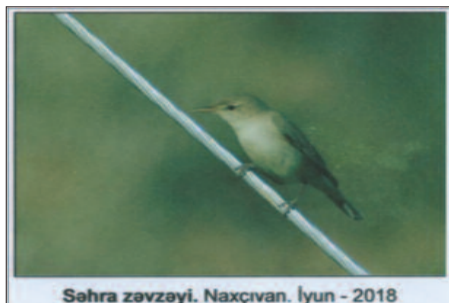
Səhra zəvzeyi. Naxçıvan. İyun - 2018