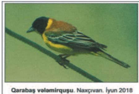
Qarabaş vələmirquşu. Naxçıvan. İyun 2018