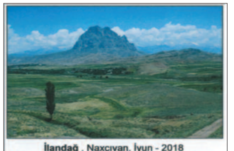
İlandağ. Naxçıvan. İyun - 2018