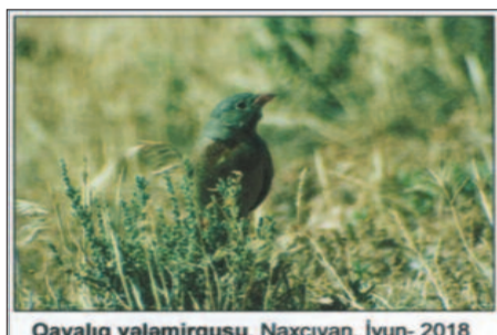
Qayalıq vələmirquşu. Naxçıvan. İyun - 2018