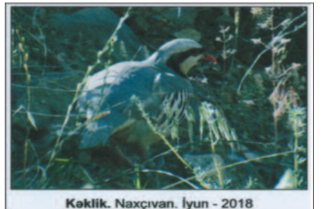
Kəklik. Naxçıvan. İyun - 2018