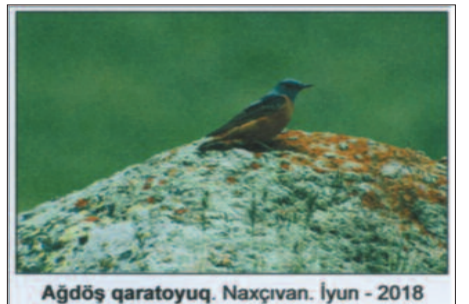
Ağdöş qaratomyuq. Naxçıvan. İyun - 2018