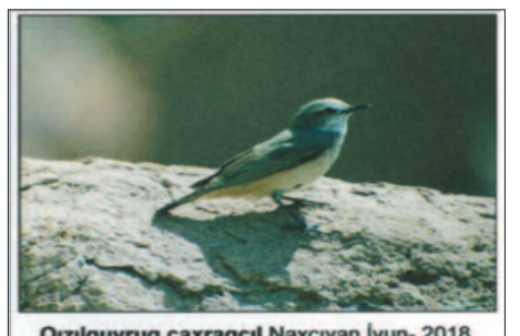
Qızılcıyruq çaxraçcılı. Naxçıvan. İyun - 2018