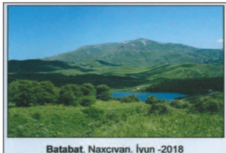
Batabat. Naxçıvan. İyun - 2018