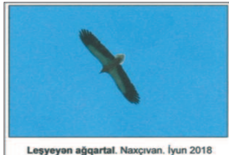
Ləşeyan ağqartal. Naxçıvan. İyun 2018