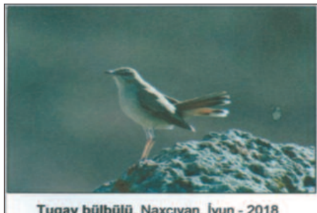
Tuqay bülbülü. Naxçıvan. İyun - 2018